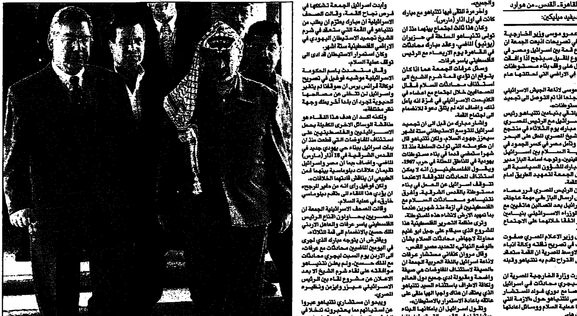
الرئيس الفلسطيني يرافيق رئيس البرلمان الاسرائيلي بعد انتهائهما اجتماعهما امس في غزة